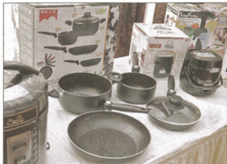
DMC Shop vertreibt mehr als 150 verschiedene Produkte